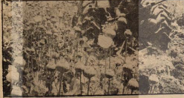
Haşhaş tarlaları silah zoruyla imha ediliyor.

Haşhaş bize serbest ektilmiyor. 5 dekar bir yerde olmalıymış. Benim zaten bir yerde bu kadar toprağım yok.