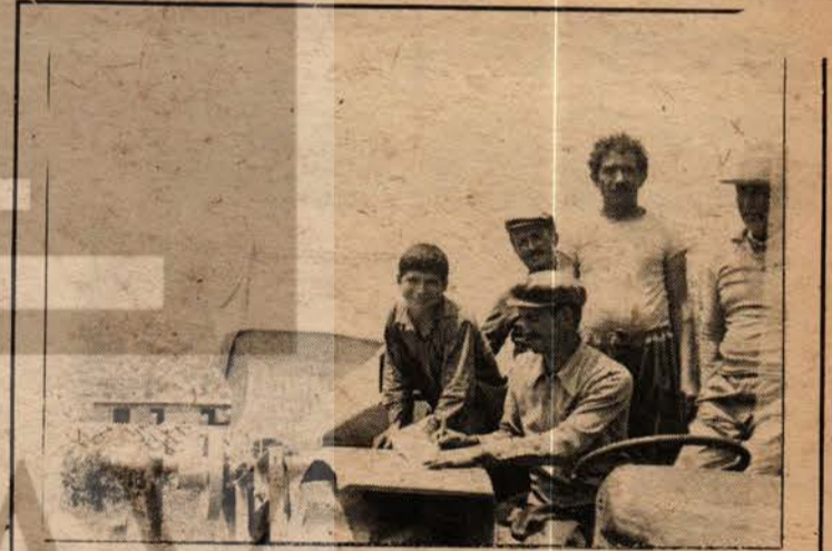
ANTALYA Gazipaşa'nın Macar köyünden tarım işçileri "Yeni Çarlarla İşbirliği Anlaşmasına Hayır" kampanyamıza imza atıyorlar.

Böyle "objektif ihtiyaç"lar, ancak emperyalist ülkeler ve özellikle iki süper devlet için söz komusudur. Çünkü sadece onların, silah zoruyla korunması gereken deniz aşırı menfaatleri vardır; çünkü sadece onlar dünyanın her köşesinde hegemonya peşinde koşmakta ve başka ülkelere zorbalık uygulamaktadırlar. "Yeni su alanlarına çıkış" işinin nasıl olacağına gelince, tıpkı eski çarlar gibi Brejnev de bu amaçla, dünya boğazları üzerindeki baskı ve tehditlerini arttırmakta, Rusya'nın sıcak denizlere açılma yollarını şimdiden ele geçirmeye çalışmaktadır. Yeni Çarların amiralleri "yeni su alanlarına çıkma ihtiyaçlarından" söz ettiklerinde bunun altında daima "Boğazları denetimleri altına almak ihtiyacı" şeklinde bir hedef yatmaktadır.