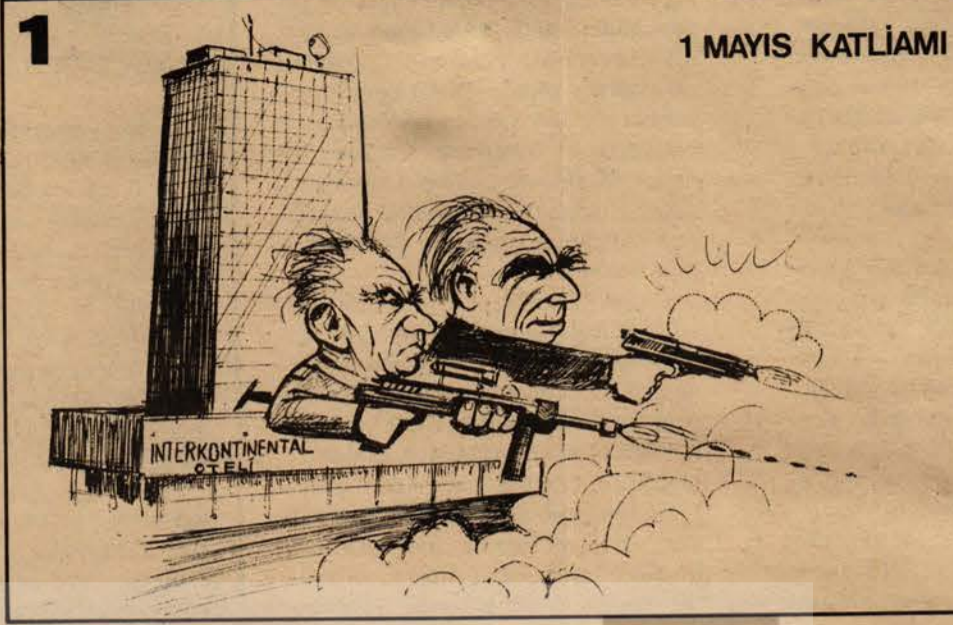
1 MAYIS KATLIAMI

Eylemcilerin gazetelere telefon ederek İnterkontinental otelini 1 Mayıs katliamının intikamını almak için kurşunladıklarını söyledikleri bildiriliyor. Oysa "1 Mayısın intikamı" denen bu olayla 1 Mayıs arasında hiç bir fark yoktur. Tıpkı 1 Mayıs'ta olduğu gibi önce Taksim meydanından geçen bir araba halkın üzerine ateş etmiştir. Sonra da silahlı militanlar oteli taramışlardır. Bu arada meydana panik yaratılmış, halk canını kurtarmak için yerlere yatmıştır. Gerek 1 Mayıs'ta, gerekse "1 Mayıs'ın intikamı" denen bu olayda halk üzerinde terör estirilmiştir. 1 Mayısla bu olay arasında sadece şu fark vardır. 1 Mayıs'ta İnterkontinental'den Taksim ala-